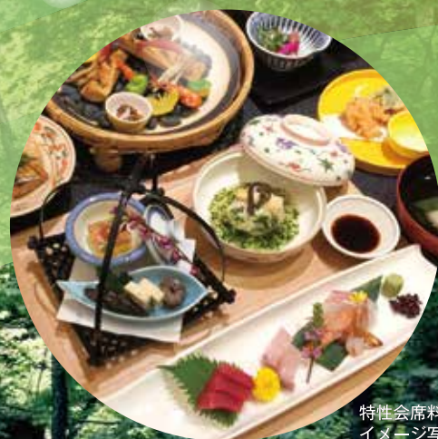
特設会席料理 イメージ写真