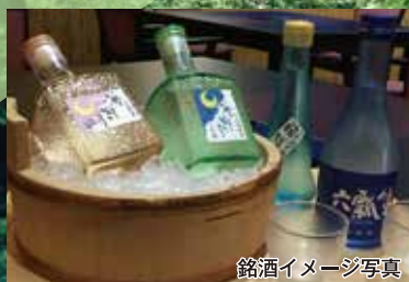
銘酒イメージ写真

四酒蔵の銘柄を会席料理と共に楽しみください。 会場内でお酒の販売を致しております。