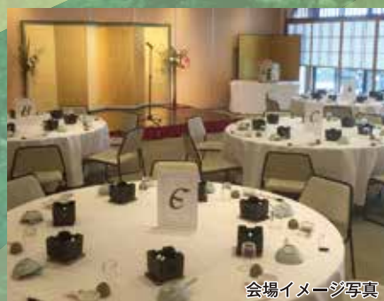
会場イメージ写真